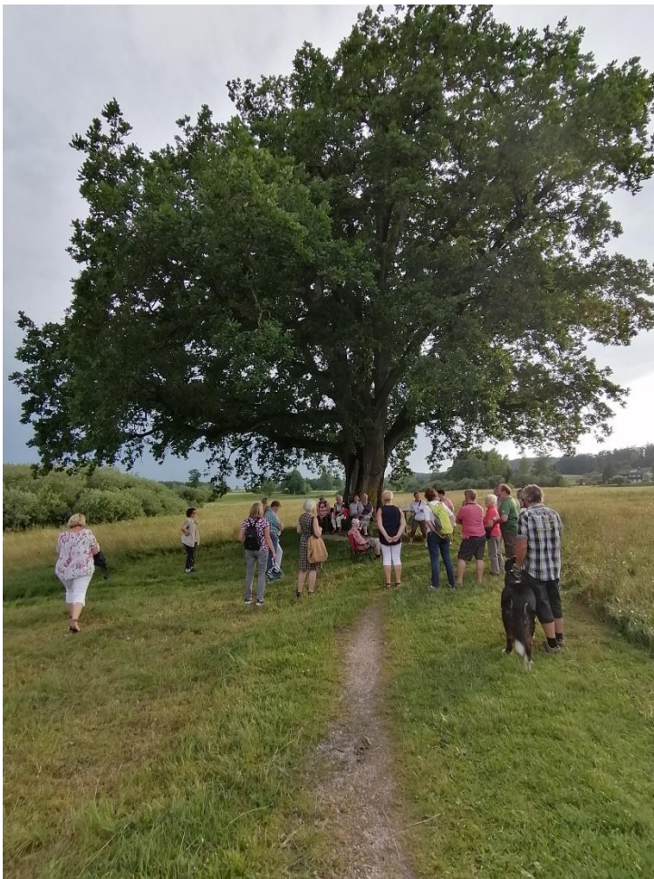
(Die berühmte Mozarteiche auf dem Seerosenweg um den Weinbergsee, unter der bereits Wolfgang Amadeus Mozart als junger Knabe regelmäßig bei seinen Besuchen im Kloster Seon zwischen 1761 - 1780 gegessen haben soll.)