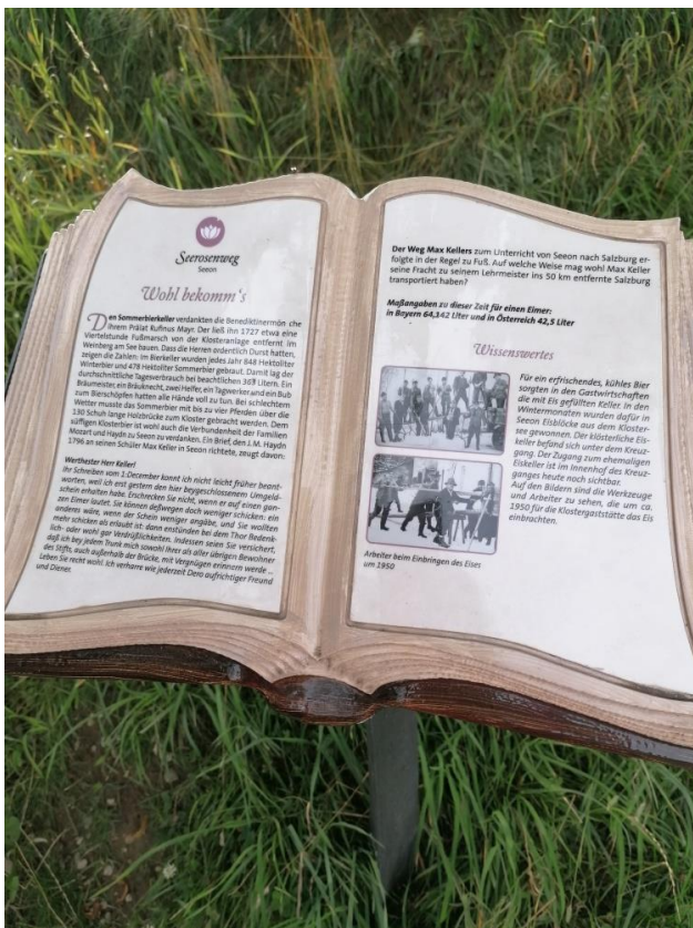
(Eine der Tafeln in Buchform auf einer Eisenstehle)